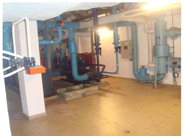
Photographie n°4 : Vue de d'une partie de la salle des groupes froids