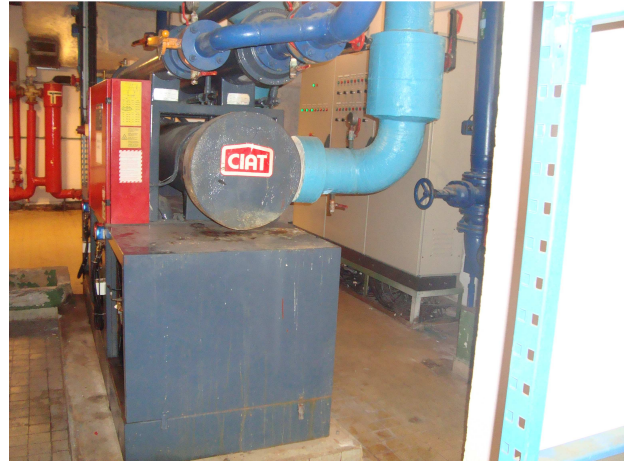
Photographie n°2 : Vue d'un groupe froid