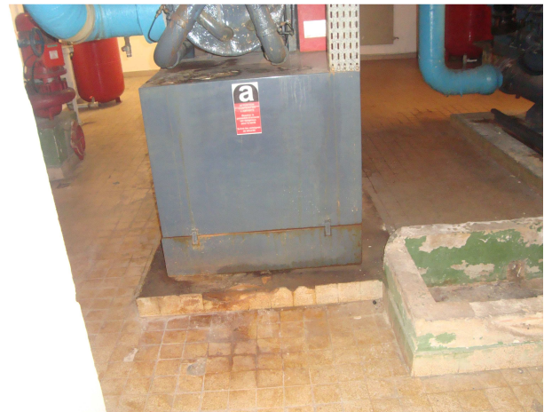
Photographie n°4 : Vue du 2° socle