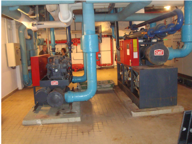
Photographies n°1 : Vue des 2 groupes froids