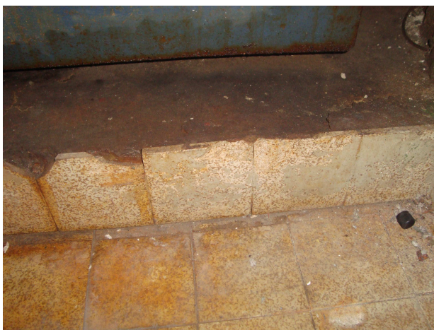
Photographie n°3 : Vue des plinthes