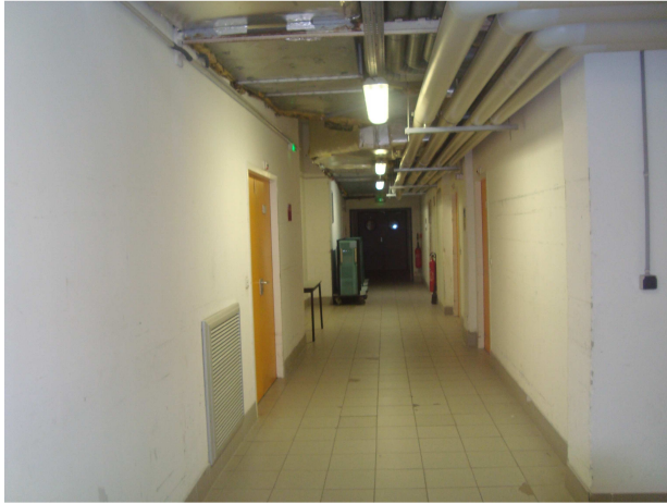
Photographie n°3 : Vue d'une partie du couloir pour sortie du big bag amiante