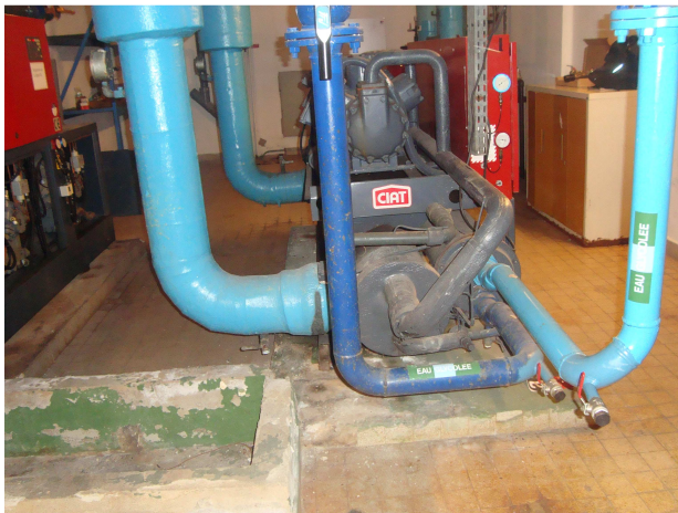
Photographie n°3 : Vue d'un socle