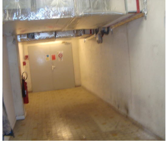
Photographie n°4 : Vue de l'accès vers la salle des groupes froids